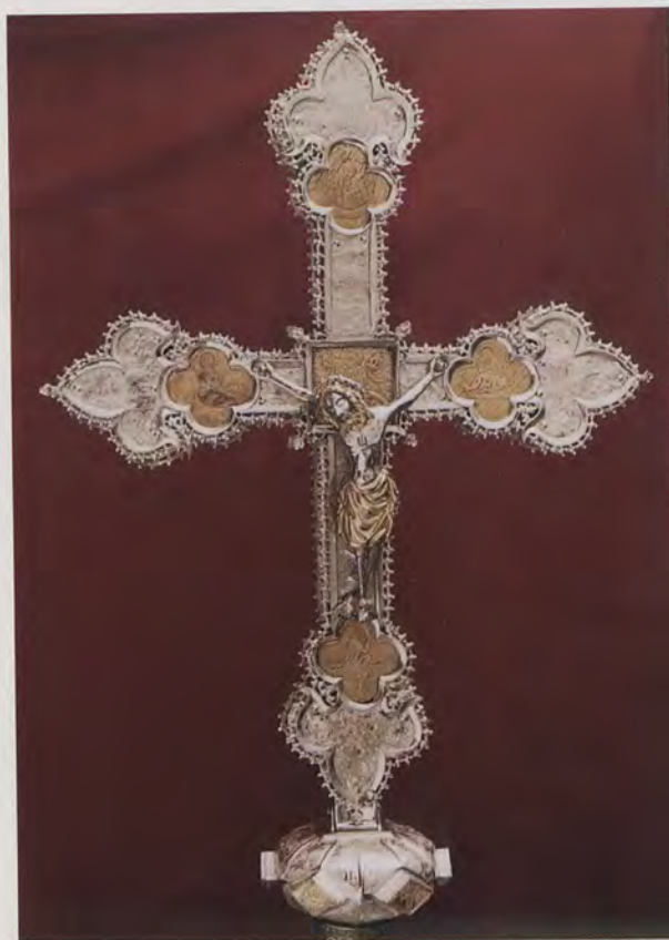
Creu processional d'Ènguera, segle XIV o XV, posterior en tot cas al privilegi reial de marcar l'escut de Xàtiva en 1310.

"No es difícil encontrar las marcas -afegeix Gil Cabrera- en número de tres, que se encuentran repartidas por todo el reverso, en el árbol inferior, en el árbol superior y en el brazo izquierdo... Recordé que en el escudo de la ciudad de Xativa, en la versión medieval que aparece en la Cruz procesional gótica de esmaltes, atribuida a Pere Bernés, o mejor en las fablas de artesanado de la iglesia parroquial de San Pedro en Xativa, figuran dos castillos, uno superior y otro inferior, unidos por una muralla y un portal central en la zona más baja de ésta, del que sobresale una señora. Nos hallabamos ante una estilización de dicho escudo y al momento las letras se nos presentaron nítidas..."